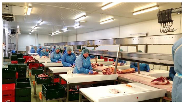
Zerlegelinie inkl. Kistentransport