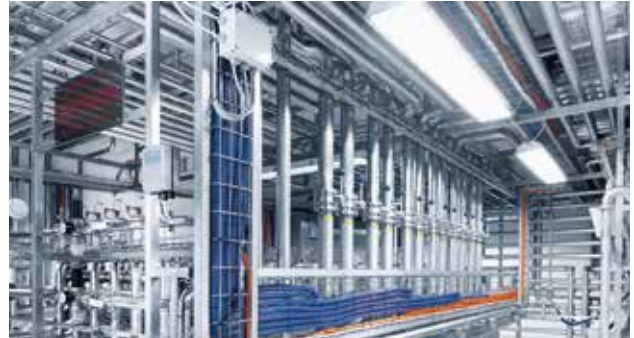
CIP Reinigung Tanklager