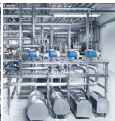
BERTSCH foodtec CIP Reinigungsanlagen