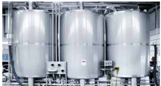
Reinigungsstation, Tankform zylindrisch