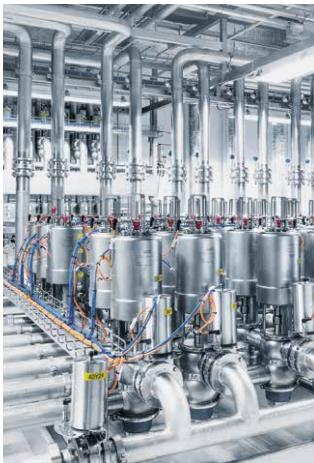
Блоки клапанов CIP