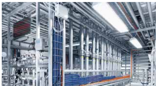
Емкость мойки CIP