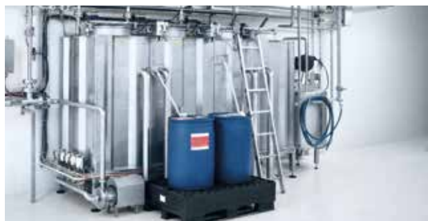
Модуль станции мойки CIP