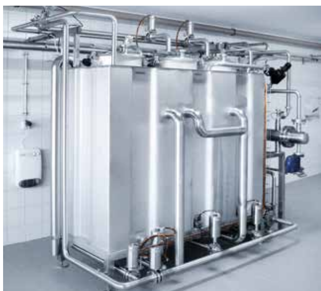
Станция мойки с емкостями кубической формы