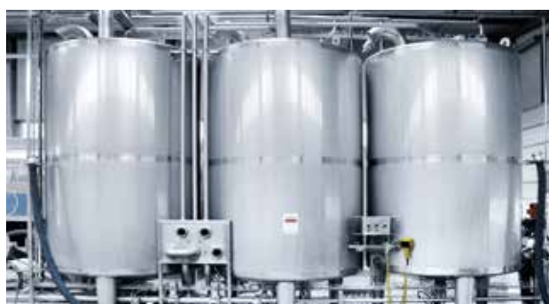
Станция мойки с емкостями цилиндрической формы