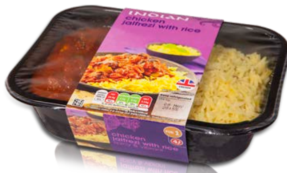
Fleisch, Beilage und Soße, automatisch dosiert auf PROSEAL