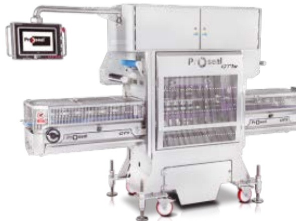
Halbautomatische und vollautomatische Traysealer. Ein- und Zweispurig mit einer Leistung bis zu 240 Trays / min