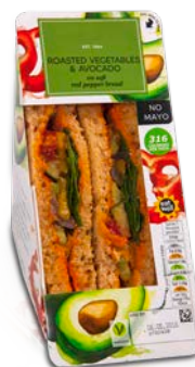
Sandwich Verpackung mit PROSEAL