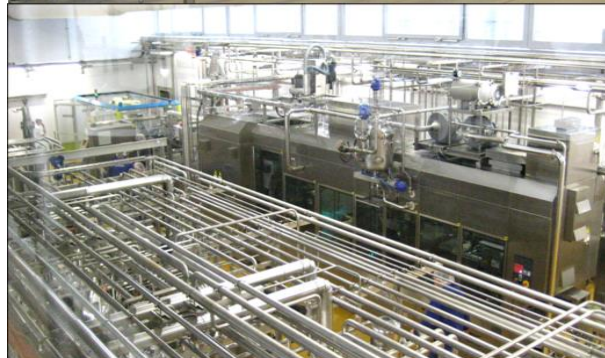
Milchpasteurisation (oben) und Abpackmaschine (unten)