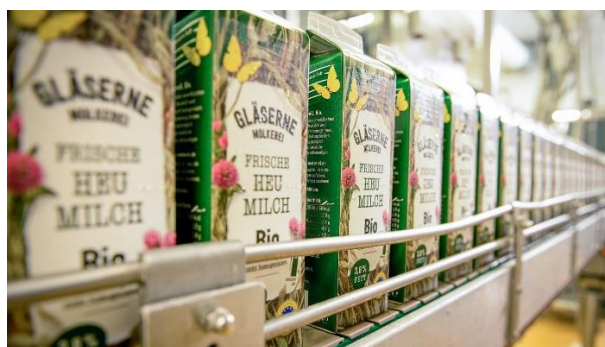
Bio-Heumilch am laufenden Band