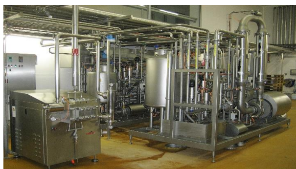
Neueste Technik und Know-how, realisiert durch BERTSCHfoodtec