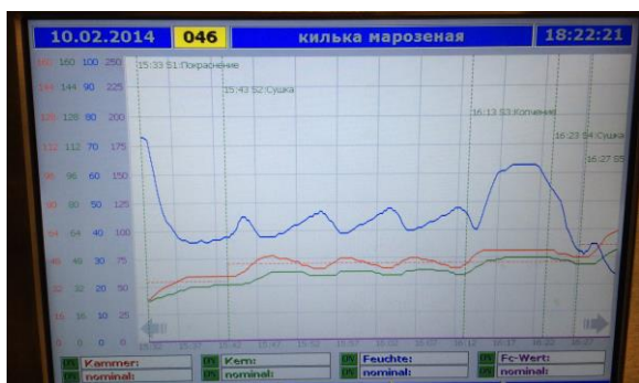
Графическая запись процесса