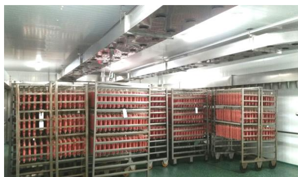
Производство сырокопчённых колбас