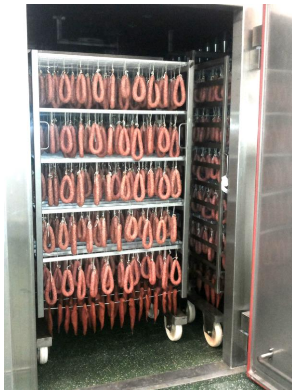
Производство сырокопчённых колбас